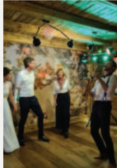
unvergessliche Hochzeit am Berg